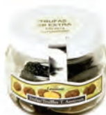
2P Extra 25gr. 700-53