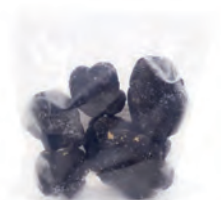
a partir de 250gr. 161-1