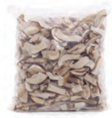
1kg. / 2kg. 110-4