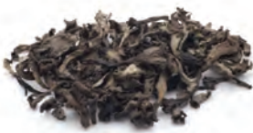
Contenido envase 217-0