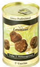
Entera 20/40 200gr. 800-72