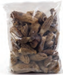
1kg. / 2kg. 132-1