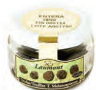
Entera 10/20 50gr. 800-33