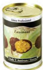
Entera 200gr. 700-03