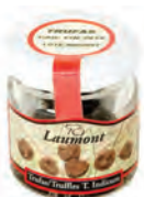
Entera 12'5gr. / 10gr. esc 500-00