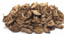
Contenido envase 231-2