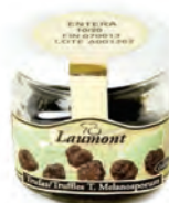
Entera 10/20 100gr. 800-51