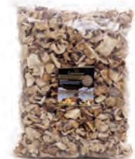
Extra 1kg. / Estandar 1kg. 252-2 / 252-1