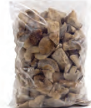
1kg. / 2kg. 107-2