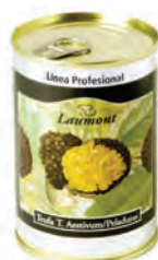
Peladura 200gr. 700-06