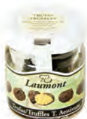
Entera 12.5gr. / 10gr. esc. 700-01