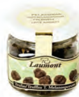
Peladura 100gr. 800-55