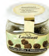
Brisura 100gr. 800-54