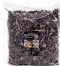
1kg. / 500gr. 217-1 / 217-11