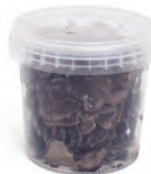
menos de 100gr.