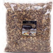
1kg. / 500gr. 231-1 / 231-11