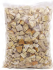
1kg. / 2kg. 101-1