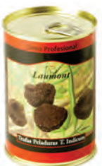
Peladuras 200gr. 500-48