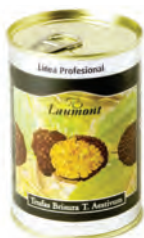
Brisura 200gr. 700-04