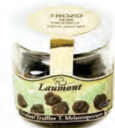
Trozo 10/20 100gr. 800-52