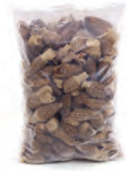
1kg. / 2kg. 132-0