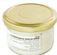
Sal 100gr. 710-02