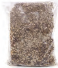
1kg. / 2kg. 109-9