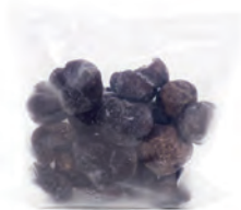
a partir de 250gr.