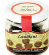
5P 100gr. 500-30