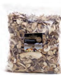
1kg. / 500gr. 205-1