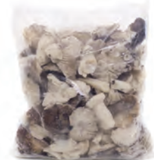
1kg. / 2kg. 217-1