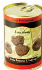
con aceite Melanos. 200gr. 500-80