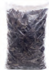
1kg. / 2kg. 117-1