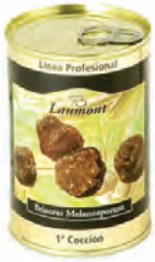
Brisuras 1ª Cocción 200gr. 800-76