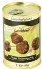
Entera 10/20 200gr. 800-69