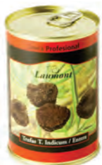
Entera 200gr. 500-40