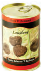
Brisura 200gr. 500-49