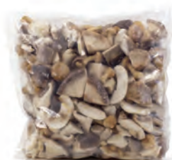
1kg. / 2kg. 105-3