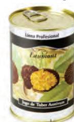
Jugo 400gr. 700-09