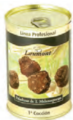
Peladuras 1ª Cocción 200gr. 800-75