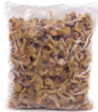
1kg. / 2kg. 115-1