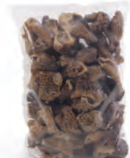
1kg. / 2kg. 132-2