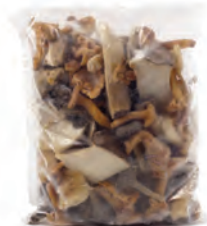
1kg. / 2kg. 105-1