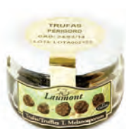
1 P Extra 50gr. 800-30