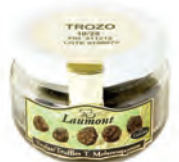
Trozo 10/20 50gr. 800-35