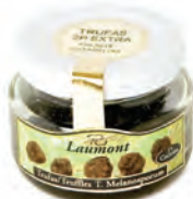
2 P Extra 25gr. 800-11