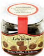
Brisura 100gr. 500-39