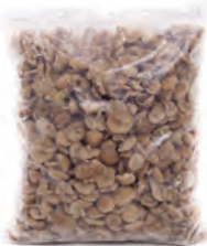
1kg. / 2kg. 131-1