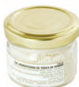
Sal 50gr. 710-01