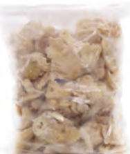
1kg. / 2kg. 151-1