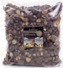
1kg. / 500gr. 246-1