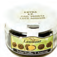
4P Extra 50gr. 700-55