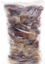
1kg. / 2kg. 132-3