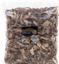
1kg. / 500gr. 209-4