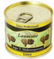
Jugo L 200gr. 900-02