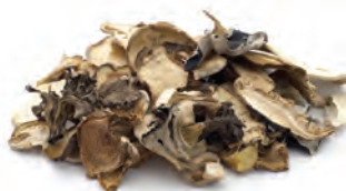
Contenido envase 205-0