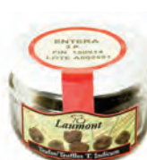
3P 50gr. 500-20