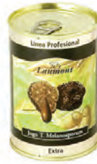
Jugo 400gr. 900-03