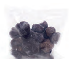
a partir de 250gr. 164-1