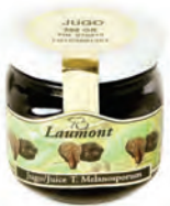
Jugo 200gr. 900-09