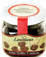
Peladuras 100gr. 500-37